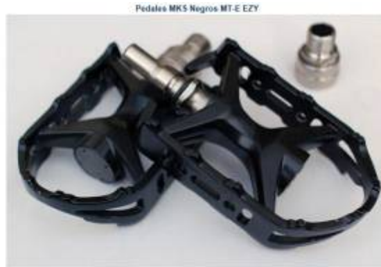
Peso: 320 gramos la pareja Color: Negro

Modelo para uso urbano o ciclismo. Alto calidad. Modelo compuesto de fibra carbon y aluminio. Asiento cómodo por ventilación. Sistema clásico de poder y quitar sin herramientas, dejando un espacio en la biela fijo que ajustable menos de 2 cm. Biela para cuando tengas que plegar la bici y meterla por ejemplo en una maleta o bolsa de transporte, o incluso en el coche.