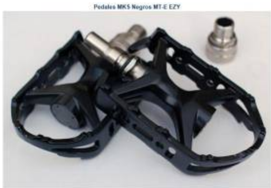
Peso: 320 gramos la pareja Color: Negro

Modelo para uso urbano o ciclismo. Alto calidad. Modelo compuesto de fibra carbon y aluminio. Asiento cómodo por ventilación. Sistema clásico de poder y quitar sin herramientas, dejando un espacio en la biela fijo que ajustable menos de 2 cm. Biela para cuando tengas que plegar la bici y meterla por ejemplo en una maleta o bolsa de transporte, o incluso en el coche.