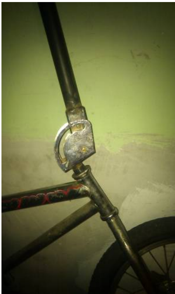
sistema de direccion