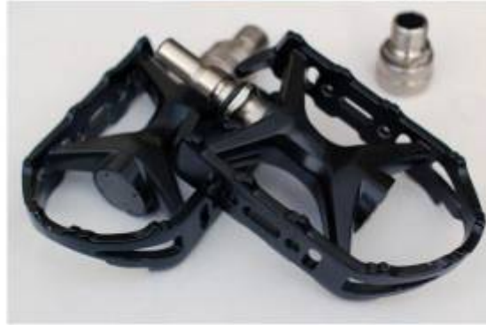
Pedales MK5 Negros MT-E EZY

2016/11/11 22:41 personas:checho:proyectos:bici_plegable https://wiki.unloquer.org/personas/checho/proyectos/bici_plegable?rev=1478904111